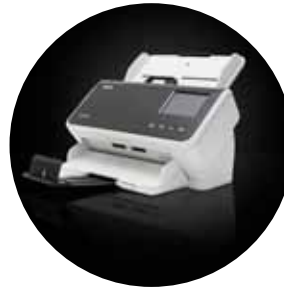
Escáneres S2060w/S2080w Alaris