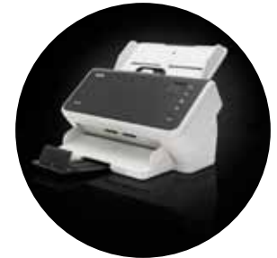
Escáneres S2040/S2050/S2070 Alaris